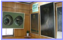
深い作品の数々でした