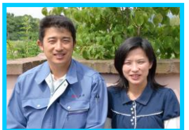
これからも よろしく願います