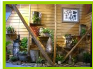
春日焼 * 龍胆窯 アトリエです!