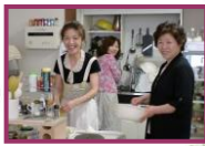
笑顔がステキです♪

週末には京阪神からも多数来園され、 GWは大忙しだったそうです! 今回は突然の 訪問にも関わらず 笑顔でお話し下さい