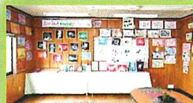
もっと見ていたかったです