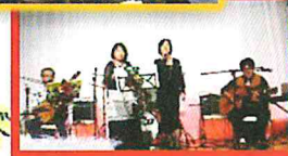
今回のステージも 楽しみです

今回の収穫祭は タケバ12 2回目、そして 早いもので4年ぶりの出演となりますマサバンド ライブをどうぞお楽しみ下さい ユーミンから三線を使った沖縄の音楽♪ 小さなお子様も大好きな曲など盛りだくさん！ 音楽の秋♪ どうぞ一緒に楽しみましょう コンサートの後は恒例となります芋掘り大会を 開催します！ 今年も一番大きなお芋を ゲットした方には 賞品が当たります♡ ほろり温かいお味噌汁も ご用意し 皆様のお越しをスタッフ一同お待ちしております