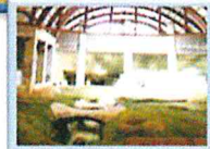
中から見ると・・・

〒677-0054 西脇市野村町字緑風台1813-11 0795-23-3000 9:00AM~5:00PM 休館日 毎週火、木曜日(祝日の場合は翌日)1/2・9・1/3