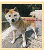
ラウちゃんにも お世話になりました