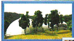
外から見ると・・・