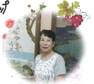
楽しいお話を ありがとうございます