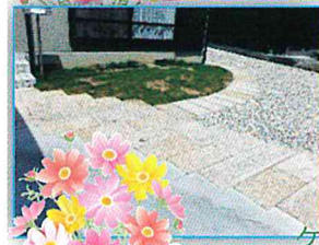
テンケンパも 出来ますね