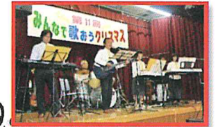
毎年恒例 コンサート♪♪