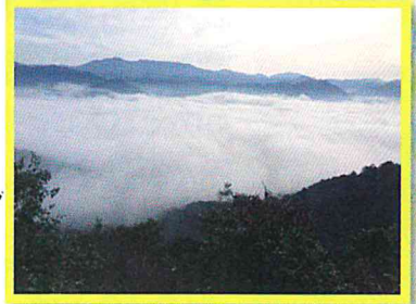
2月には雲海も見えました

西脇市坂本の西林寺の奥から山を越え、日野町へと続く約2kmの林道にある展望台です。自動車で行けるので手軽に行くのも良いですね。また登山道もあるのがこの頃の季節、ハイクがおすすめです。白の