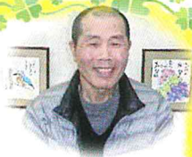
楽しい時間を ありがとうございます

今から5~6年前、お姉様からの勧めがきっかけでした。 その際、之の道具を譲り受け、絵手紙の本を買われ 一から独学で絵手紙を始めました。 それ以来、身の周りの自然~季節毎の花や鳥など 目にとまるものを作品にさせていただきます。 どの作品もオリジナルの温かいものばかりです どうぞ春のひとときお越し下さい お待ちしております