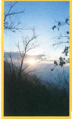
今年の初日の出です

西脇市坂本の西林寺の奥から山を越え、日野町へと続く約2kmの林道にある展望台です。自動車で行けるので手軽に行くのも良いですね。また登山道もあるのがこの頃の季節、ハイクがおすすめです。白の