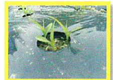
植えて1週間目です