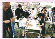
上手く焼けましたか？

イベント当日、お天気が少し心配でしたが 会場中々マカワの皆さんの華やかな ステージで晴れやかな気持ちにな りました♡ ありがとう ございました。 おどろき 甘酒も大好評につき 今回も 完食♡ ヒコが、棒焼きパンにトライしている 途中から ついに雨が...と 皆様 風邪など つかまいませんか？ たくさんの方にお越しいただき 本当に ありがとう ございました♡