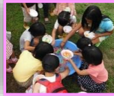
スーパーボールすくいも 楽しかったですね♪