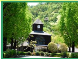
心地良い風が吹いています ♪♪